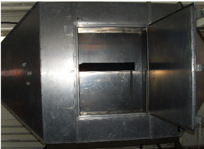
Abb: 3,5m TEM Zelle Magic Power Technology GmbH

Wir als Magic Power Technology GmbH betreiben eine EMV-Messkammer für Messungen der leitungsgeführten Störungen. Für die Messung der Abstrahlung verwenden wir eine 3,5m TEM-Zelle und ein 3m Freifeld (OATS). Gerne bieten wir unseren Kunden an, deren Applikation als Vormessung oder bei Problemen bei uns zu testen